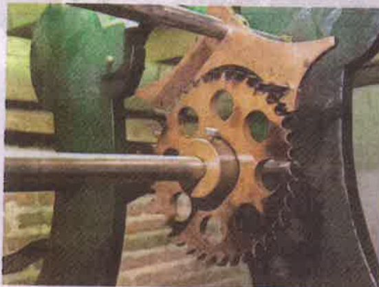
Het 'echappement' van het uurwerk.