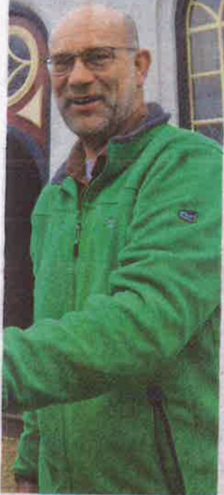
t witte kerkje van Hauwert.